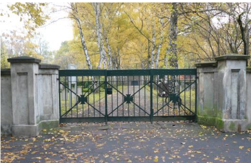
Eingang Fössefeldfriedhof, Friedhofstraße

Anfang April 1945 zog die US-Armee von Westen kommend durch die Limmerstraße in die Innenstadt von Hannover und beendete damit die Herrschaft der Nationalsozialisten in Hannover. Am 8. Mai endete der 2. Weltkrieg. Im Umfeld des 8. Mai gedenkt die Otto Brenner Akademie in Zusammenarbeit mit anderen Projekten wie Quartier e.V. einiger der Opfer des Nationalsozialismus. Im Mittelpunkt stehen die Themen Deserteure, Widerstand, Zwangsarbeit und Arbeiterbewegung in Linden/Limmer.